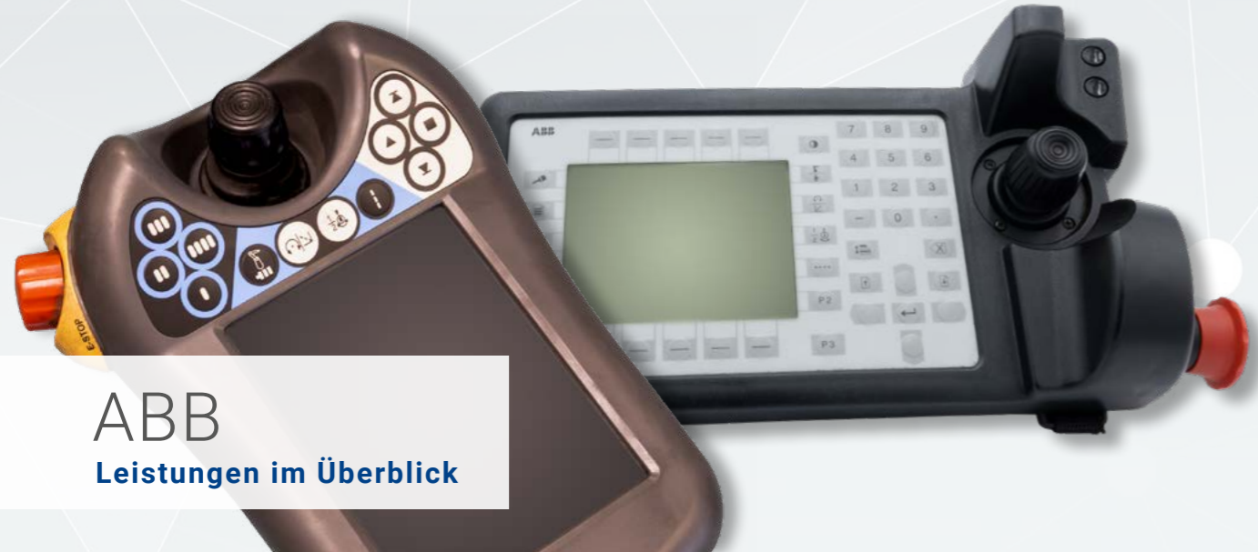
ABB Leistungen im Überblick